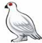
ՎԳՐԼԳԵ un lagopède