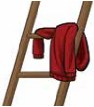
ᓴᐃᖅ un blouson