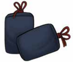
ԴՏԼՃԵ des sacs de couchage