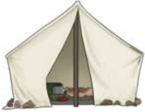
ՃԼԳԵ une tente