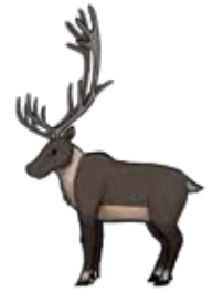
כ״כ un caribou