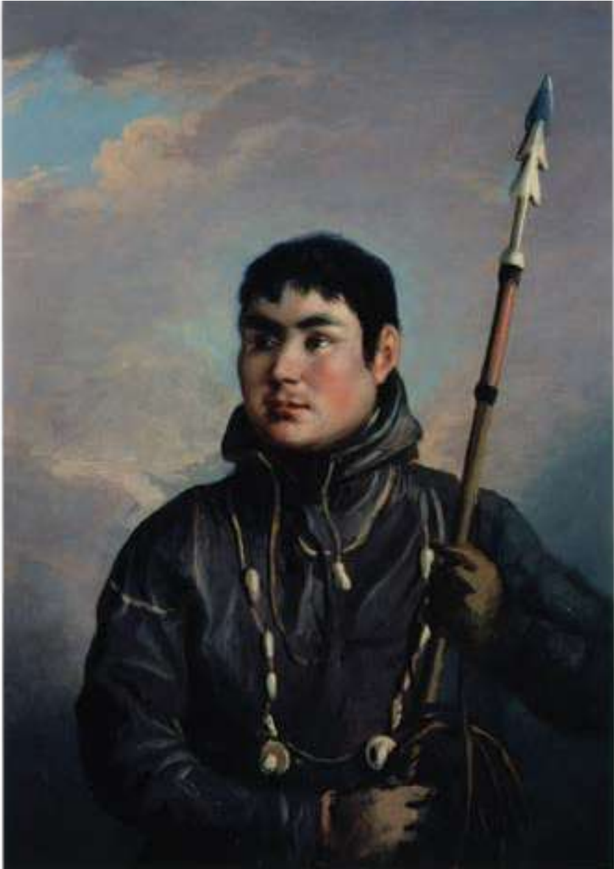
▷ Ը ՎԵԻՆՉԻՑ ԶԿԸ ԻՄ ԿՐԻՍՏՈՍՎԵՐՏԻՍԻՆ.